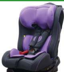
Автокресло группы II для детей массой 15-25 кг