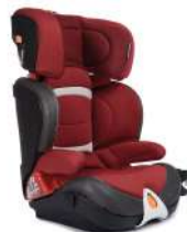
Автокресло группы III для детей массой 22-36 кг (возможно использование бустера)