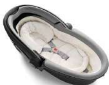
Автокресло «люлька» группы 0 для детей массой менее 10 кг

Детские удерживающие устройства подразделяют на 5 весовых групп: