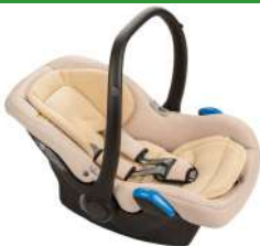
Автокресло группы 0+ для детей массой менее 13 кг