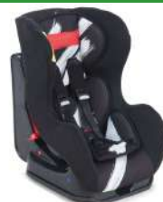
Автокресло группы I для детей массой 9-18 кг